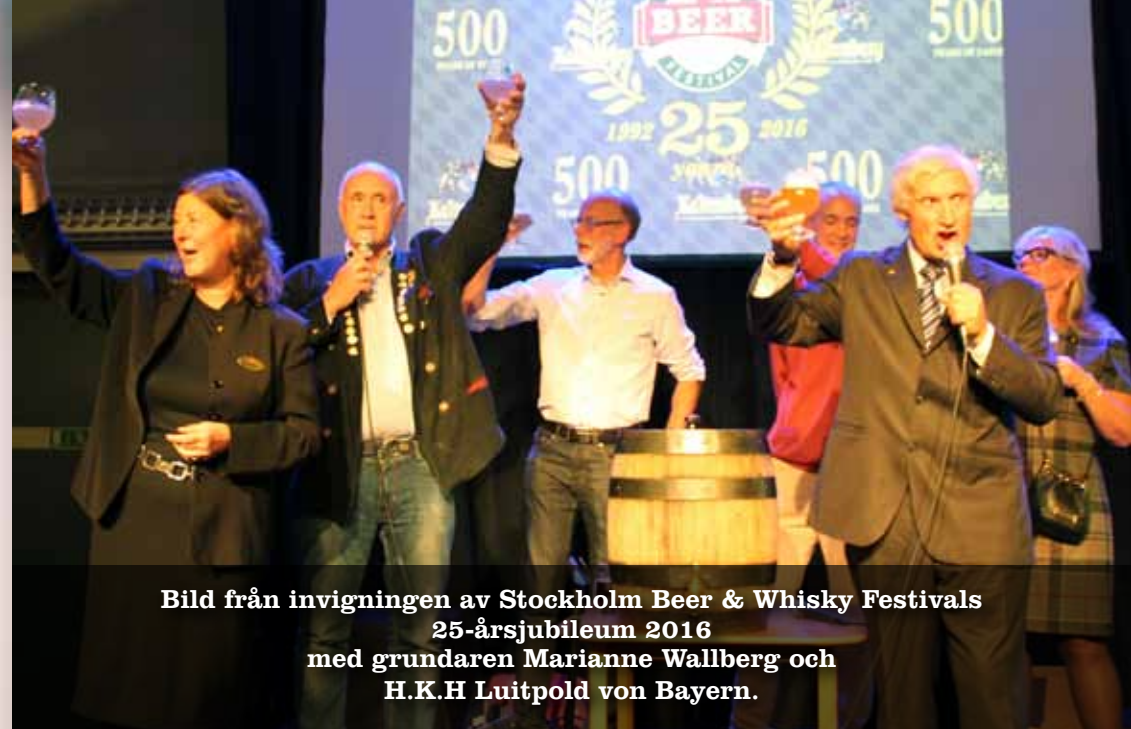
Bild från invigningen av Stockholm Beer & Whisky Festivals 25-årsjubileum 2016 med grundaren Marianne Wallberg och H.K.H Luitpold von Bayern.