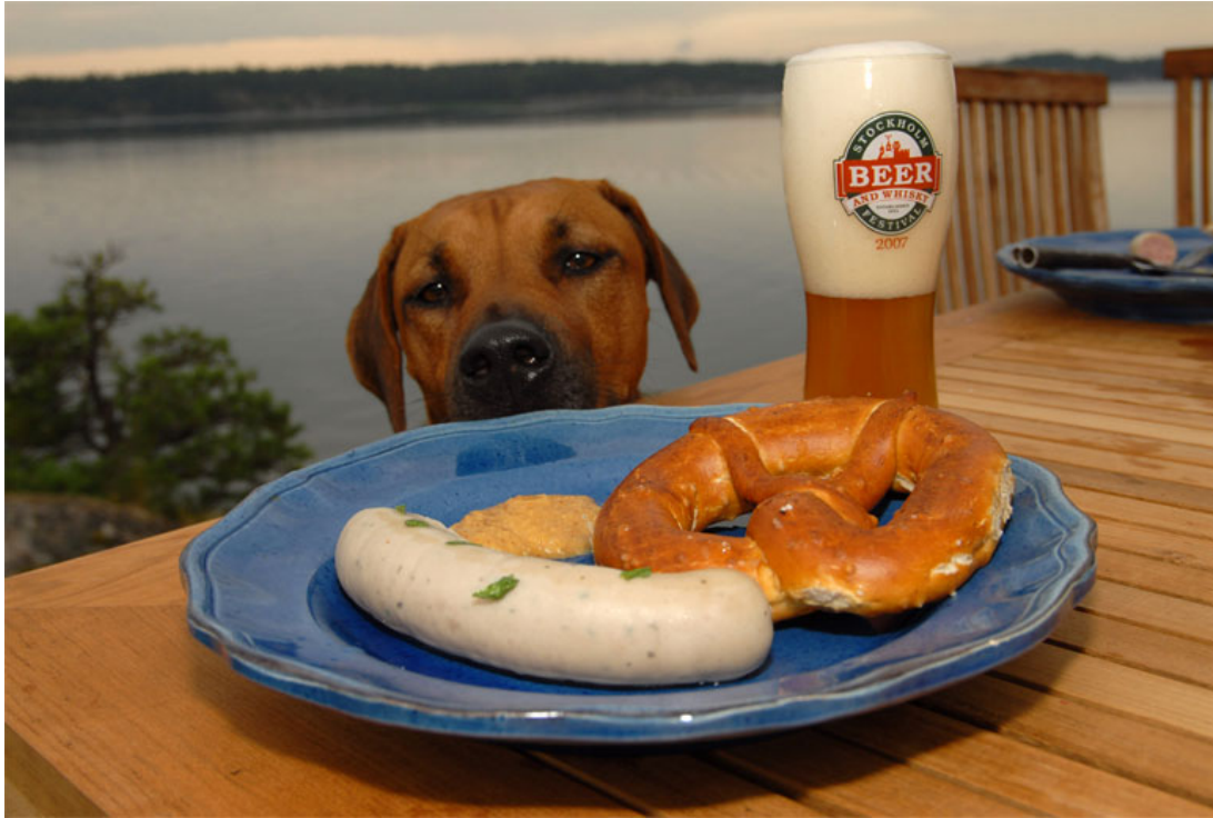
Mums säger Puma...