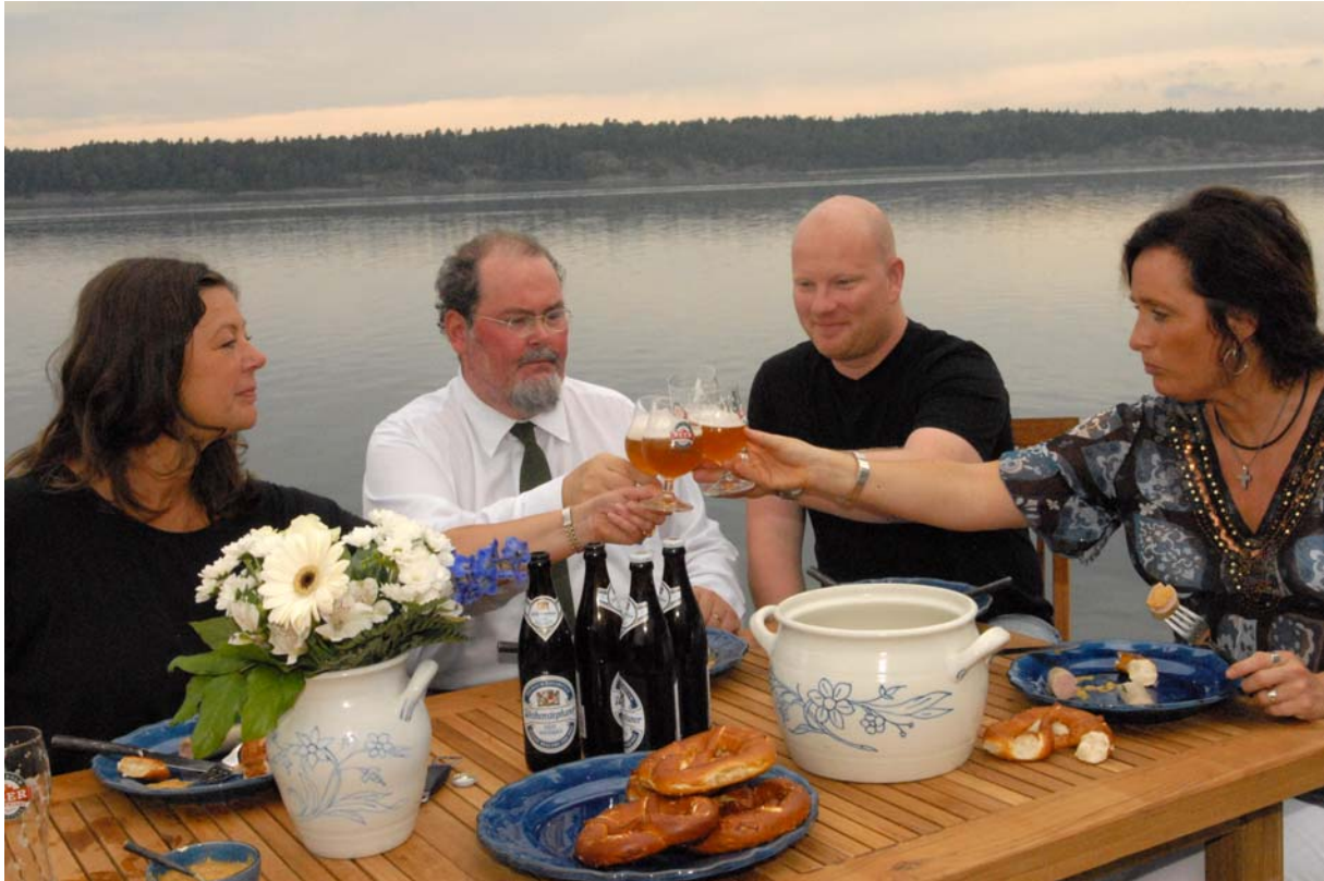
Skål för årets Stockholm Beer & Whisky Festival!